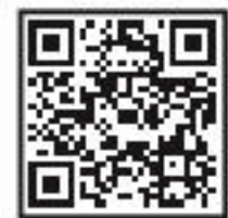
안전체험관 홍보영상 QR

가상 재난 체험을 통한 안전 습관 형성으로 각종 재해의 예방과 위험으로부터 도민의 안전을 증진하는 체험중심 교육기능의 종합안전체험관입니다.