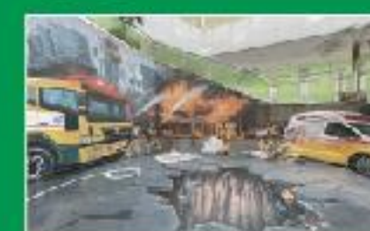
트럭아트 & 포토존